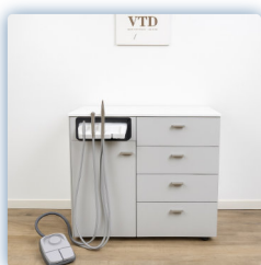
Gris clair mat