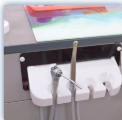
Écran moteur élec. spray int.