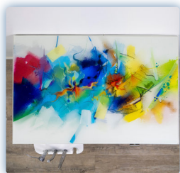
Plan de travail en verre