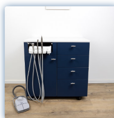
Bleu pétrole mat