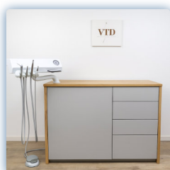
Gris clair mat