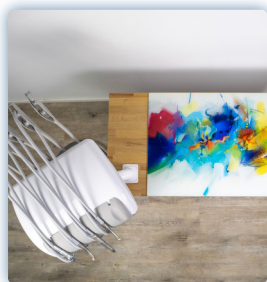
Plan de travail en verre