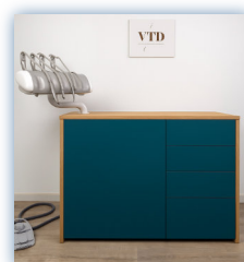
Bleu pétrole mat