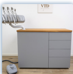
Gris clair mat